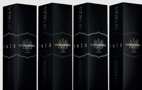
ASTUCCIO 1673 0,75 L