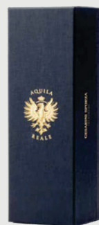
COFANETTO NERO AQUILA REALE 0,75 L