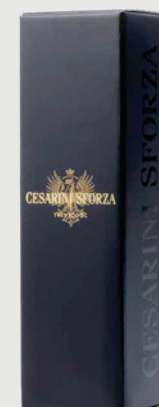
ASTUCCIO NERO 1,5 L