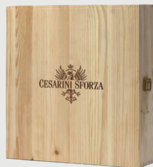
CASSETTA LEGNO 3 X 0,75 L