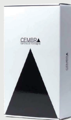
ASTUCCIO 2 X 0,75 L