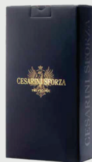
ASTUCCIO NERO 2 X 0,75 L