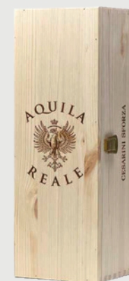
CASSETTA LEGNO AQUILA REALE 1,5 L