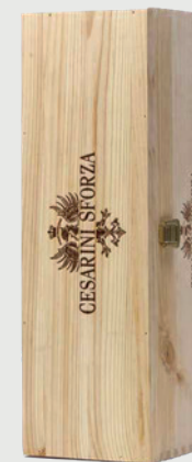
CASSETTA LEGNO MAXI FORMATO 1,5 | 3 | 6 | 9 L