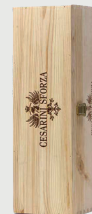
CASSETTA LEGNO MAXI FORMATO 1,5 | 3 | 6 | 9 L