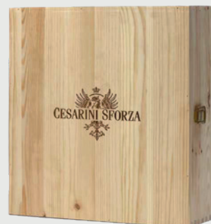
CASSETTA LEGNO 3 X 0,75 L