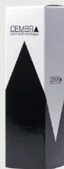
ASTUCCIO 0,75 L