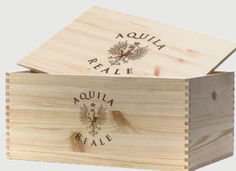
CASSETTA LEGNO AQUILA REALE 6 X 0,75 L